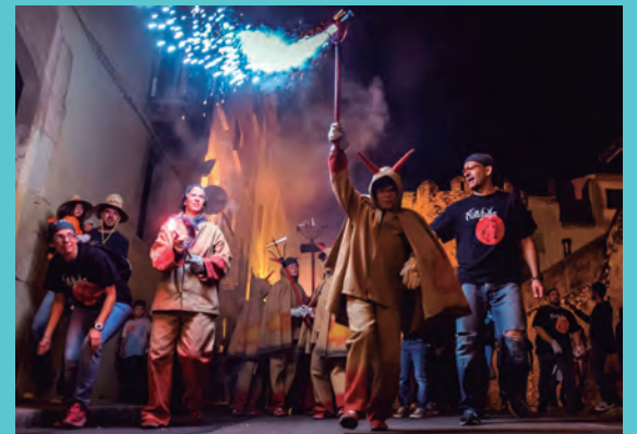
Actuació a Baix a Mar.

Hem tirat endavant algunes iniciatives que han repercutit en millores de les festes populars a casa nostra. Per exemple vam proposar que hi hagués actuació de foc la nit de Sant Joan i també acompanyar la comitiva fúnebre del Carnestoltes el Dimecres de Cendra, ara aquest acte queda més lluit. Igualment, vam impulsar la sortida de tot el seguici a la processó de l’11 de setembre. I organitzem el joc del quinto.