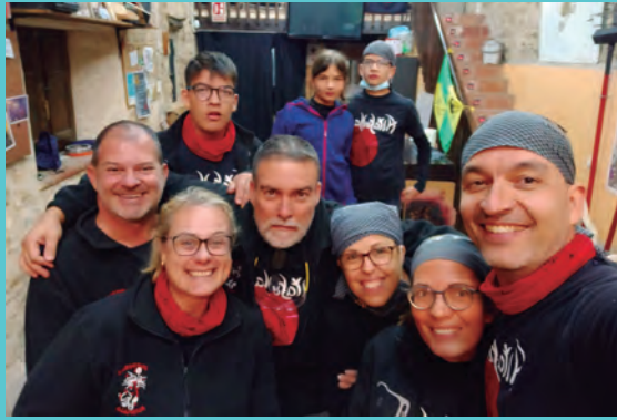
Antiga junta dels Diables Petits.

No és ben bé una llista d’espera, però sí que hi ha un període determinat per apuntar-se perquè cal passar una formació per poder afrontar les diferents actuacions de la temporada. No pot apuntar-se algú a mitja temporada si ja hem iniciat actuacions. Es necessita un període d’adaptació i aprenentatge. Quan s’obre l’entrada de petits diables aquests fan la formació i decideixen si es volen quedar o no. Hi ha qui ho prova i, lògicament, pot no agradar-li. Els pares també han de fer aquesta formació. Tothom és benvingut als diables si en vol formar part, ningú pot dir que no l’hem acceptat. Cada any som uns 50-60 nens i nenes. I anem fent rotacions, tenim unes 20 casaques, i segons l’actuació surten uns o altres, però la resta també venen i ajuden. En una actuació s’han de fer més tasques a banda de tirar les carretilles!