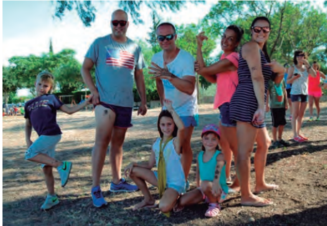
Imatge d'arxiu de les festes d'estiu de Brises del Mar recuperades l'estiu passat.

Si els terminis avancen com està previst, la urbanització de Brises del Mar podrà connectar-se al subministrament d'aigua provinent del riu Ebre el pròxim any 2021. D'aquesta manera es donarà resposta a una demanda històrica del veïnat i a una idea que feia anys que estava adormida als calaixos del consistori. Això serà possible gràcies a una subvenció que ha rebut l'Ajunta-