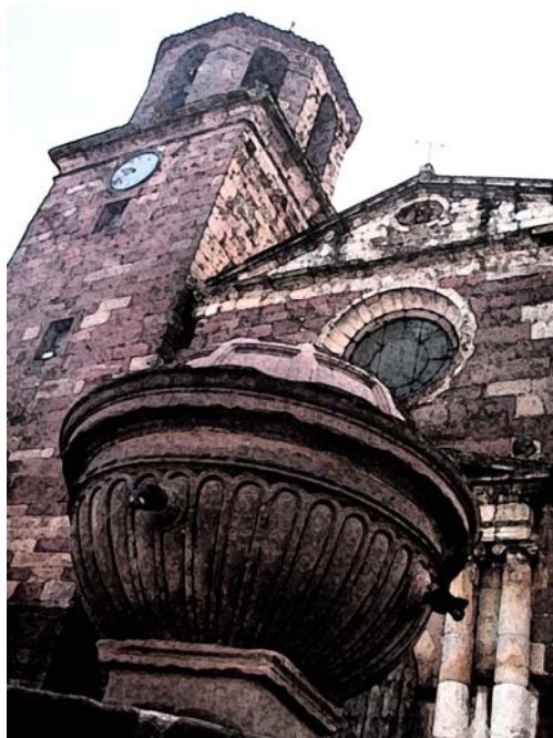
Font de Prades